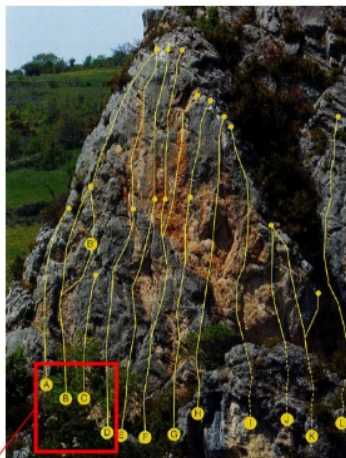
Fermeture temporaire des voies

A : Sessate B : Dièdre Rouge C : Le 6c nouveau est arrivé D : Le pilier