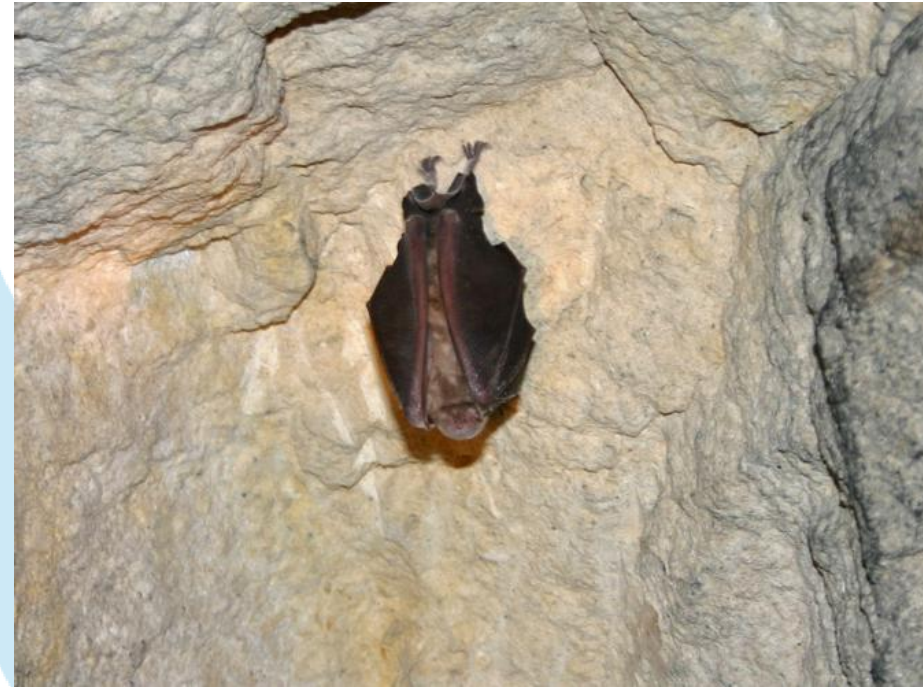
Rhinolophe dans la posture du rouleau de printemps inversé

Merci pour elles, et n'oubliez pas qu'elles vous rendent service quotidiennement en mangeant les insectes (moustiques, ravageurs des cultures, des forêts ...)