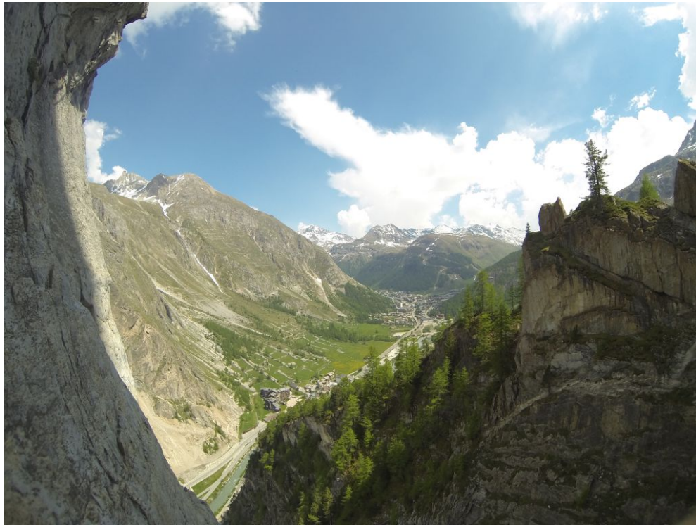
Via Ferrata du roc de Tovière

L'hébergement : réservations au camping ONLY CAMP de Tignes Onlycamp est la même chaîne de camping qu'à BEAUFORT ou nous avons apprécié la simplicité et le calme. A noter , qu'il est possible de louer tente avec lit pour 4 ou petite cabane pour 2 .