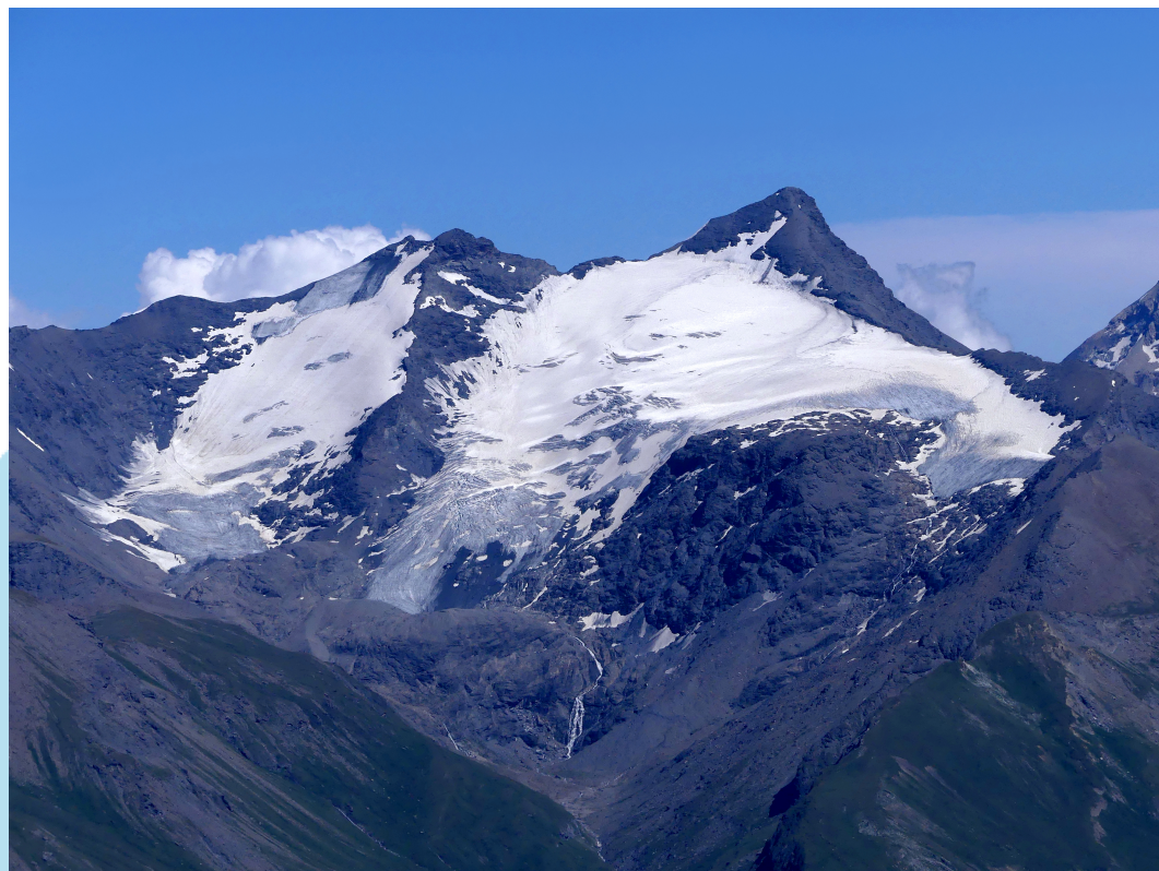
Petite et Grande Sassièrre vues depuis les Aiguilles Rouges (Wikipédia)

Pour info, sur les 30 places prévues, 18 sont déjà réservées! Inscription avant le 1er juin.